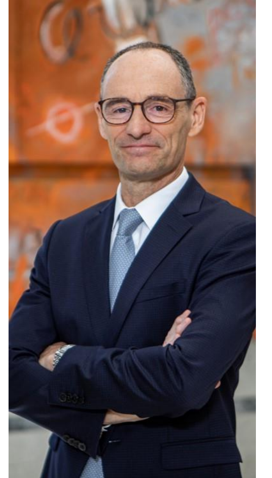
जोन अमीगो Applus+ सीईओ

आपकी मदद से, Applus+ उस विश्वास को हासिल करना जारी रखेगा जो हम सभी को इस पर है।